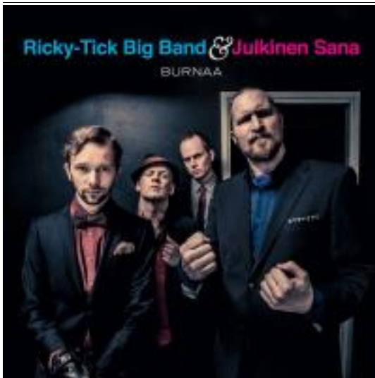
Burnaa de Ricky-Tick Big Band & Julkinen Sana